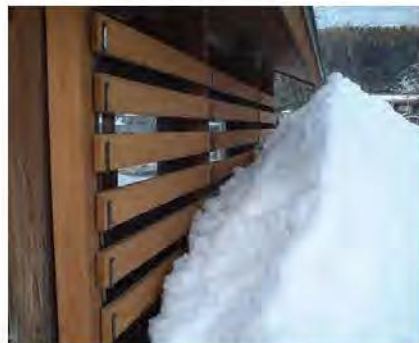
十手型金具施工例

万能クリアガードや材木の取り付け金具です。 ①コの字金具、十手型金具、貫抜型は鉄とステンレスの2種類ご用意しました。 ②サッシ対応角パイプは壁から付加する事ができ、サッシの出を避けるのに便利です。