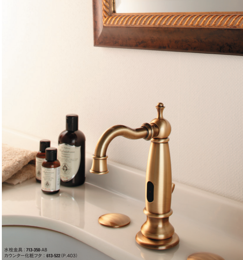
水栓金具：713-350-AB カウンター化粧フタ：613-522 (P.403)