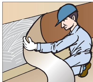
●塩ビタイル・シートの腰壁への施工