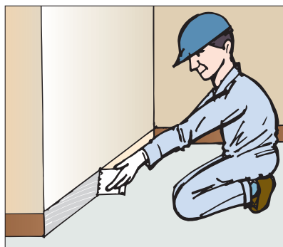
●ソフト巾木・ワイド巾木の施工