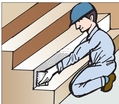
●階段の立ち上げ、ササラ巾木の施工