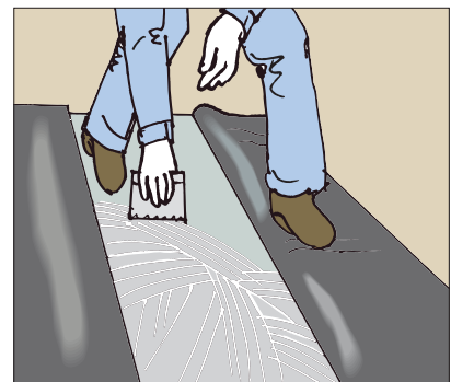
●ビニル床シートの施工に