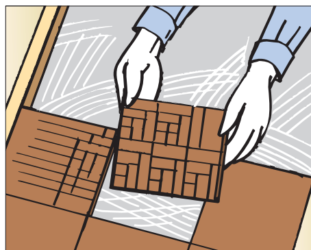
●パーケット等の施工に