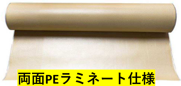
両面PEラミネート仕様