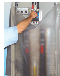
万一の接触到備えることで安心して作業可能