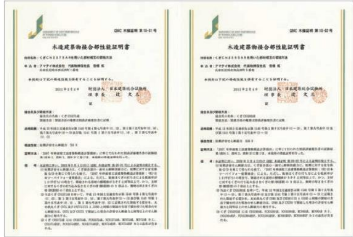
木造建築物接合部性能証明書