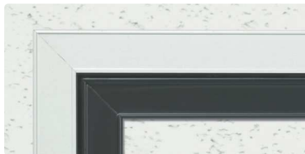
ツートーンWB (外枠バニラホワイト・内枠カスタムブラック)