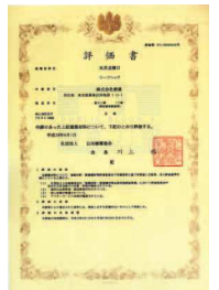
公共建築協会認定品は 吊り金具タイプに限ります。