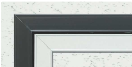
ツートーンCV (外枠カスタムブラック・内枠バニラホワイト)