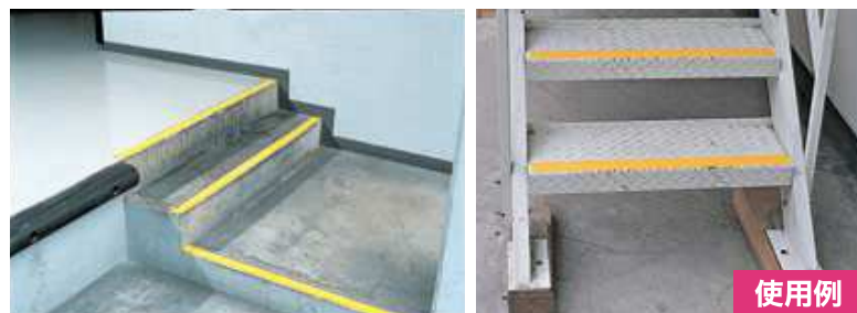
すべり止めテープ 平面用