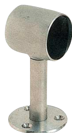
丸パイプ受 直軸 木ネジ座