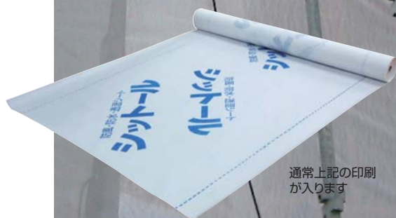
通常上記の印刷が入ります