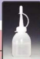
モータ部・ハンマ部 兼用オイル