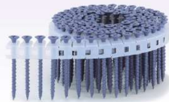
PS3851MWノンクロム (ムラサキ) D