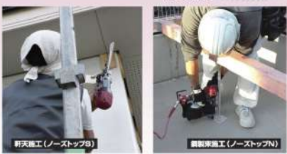
軒天施工(ノーストップS)

釘によっては両方のノーストップで使用できますので、部品交換の頻度を少なくできます。※釘ごとに実用できるノーストップが複数種類で異なります。