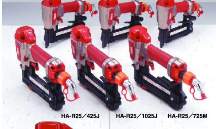
HA-R25/425J HA-R25/1025J HA-R25/725M