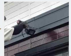
3 幕板カバーの取り付け 納まり図をご確認ください。