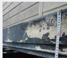
1 既存幕板及び下地確認