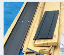
2 本体切断及び隙間調整 (必要に応じて)