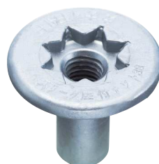
デュラルコート品 (SZN-38D)