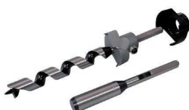
専用座掘錐 (詳しくは P.190 をご覧ください)

※六角ソケット 19mm 幅 座金 50 個毎に 1 個付き。 ※ギヤビットのみの販売もごございます。 (詳しくは P.189 をご覧ください)