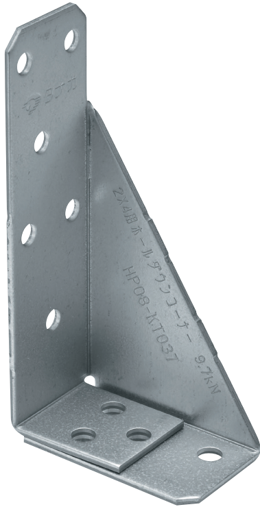
TBA-65 たて枠側 (使用本数6本)