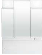
3面鏡全収納タイプ