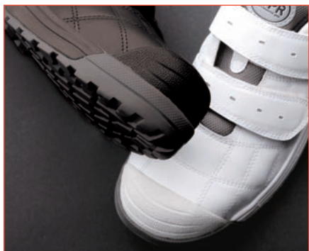
傷つきやすい頭部を護る ラバートゥガード

プロフェッショナルという名前のダイナスティ。仕様のすべてがプロの用途に耐えるスペックで安全作業靴の最高峰です。勿論 JSAA 認定 A 種合格。