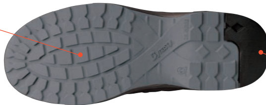
耐滑区分3のアウトソール