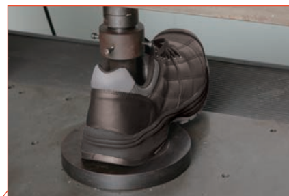
衝撃吸収材ポロンを内装 抜群の耐衝撃性で疲れ知らず