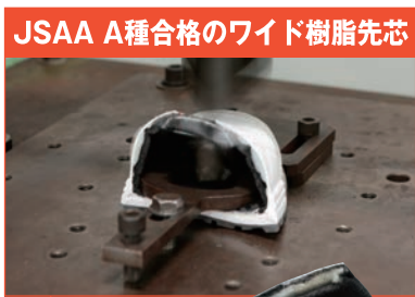
JSAA A種合格のワイド樹脂先芯