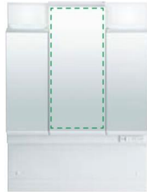
3面鏡全収納タイプ