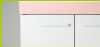
VP1P [洗面器]ピンク [扉]ホワイト