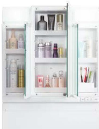
3面鏡全収納タイプ