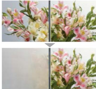
くもり止めコートなし くもり止めコート付

電気を使わず表面コーティングでくもりを抑えるので、待ち時間がなく消し忘れもない、ストレスフリー・電力フリーのくもり止めコート。