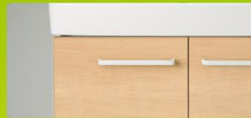
LP2W [洗面器]ピュアホワイト [扉]クリエペール