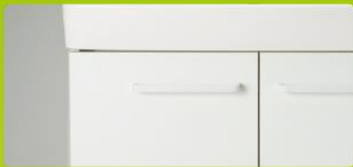
VP1W [洗面器]ピュアホワイト [扉]ホワイト