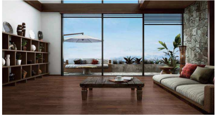
床材：エクオスピュアシルク(ウォールナット)(2P) YP7701-70 ¥41,900/梱