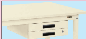
キャビネット2段付 (NKL-20 (I) □)