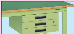
キャビネット3段付 (NKL-30 (I) □)

※キャビネットは、NKL-10・20・30以外にNKL-S10・S20・S30、NKL-11・22・33、WKL-1(D750・900タイプのみ)の取付けが可能です。(アイボリー色もあります)