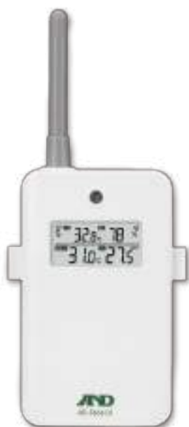
子機 (外部センサー・送信機)