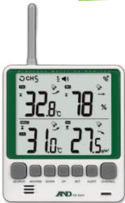
親機 (表示器・受信機)