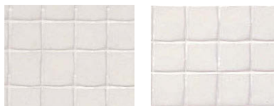
●一般タイプ マジキリIIイトイリ