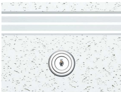
WA (ホワイトアルマイト)