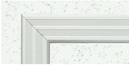
WA (ホワイトアルマイト2)

支持金具タイプ カラー・吊り金具タイプ カラー・ 支持金具タイプ カラーカギ付・吊り金具タイプ カラーカギ付