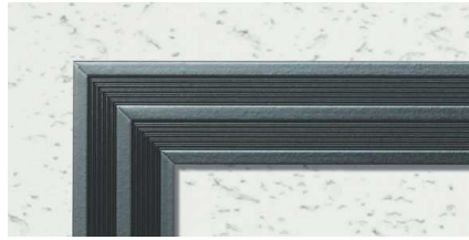
CB (カスタムブラック)