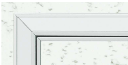
WA (ホワイトアルマイト2)