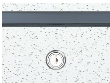
CB (カスタムブラック)