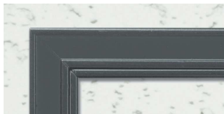
CB (カスタムブラック)