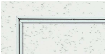
WA (ホワイトアルマイト2)