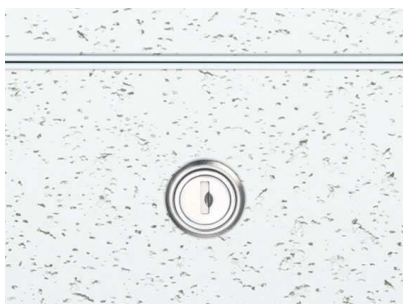
WA (ホワイトアルマイト)