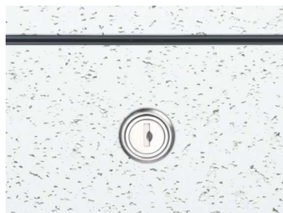
CB (カスタムブラック)

リーフ目地タイプ1と タイプ2の詳細は、 P10・P11・P13を ご覧下さい。