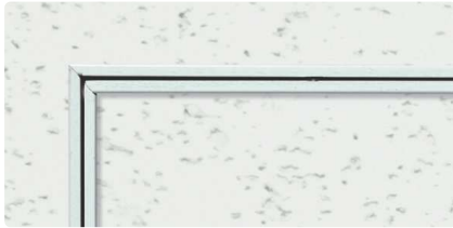
WA (ホワイトアルマイト2)