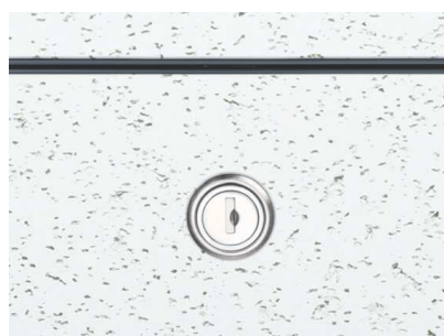
CB (カスタムブラック)

リーフ目地タイプ1と タイプ2の詳細は、 P10・P11・P13を ご覧下さい。