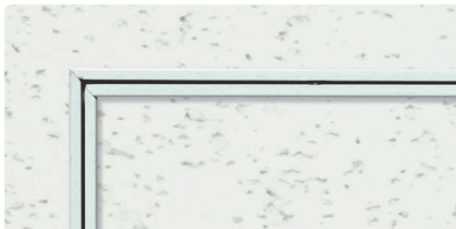
WA (ホワイトアルマイト2)