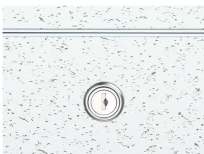
WA (ホワイトアルマイト)