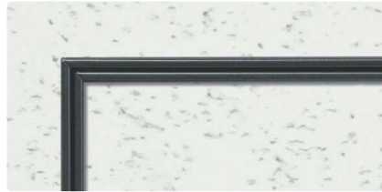
CB (カスタムブラック)