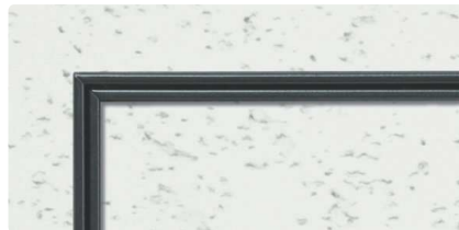
CB (カスタムブラック)