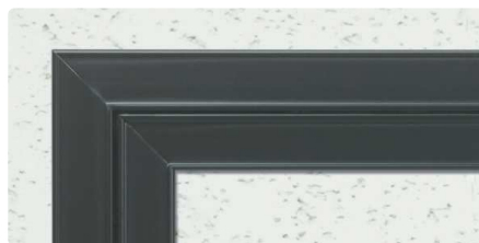
CB (カスタムブラック)