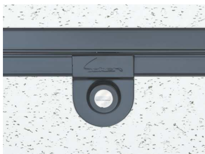
写真はCB (カスタムブラック)