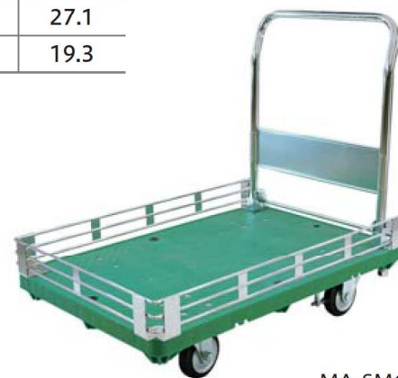
MA-SMG-3 ※ハンドル固定付もできます。