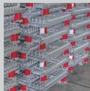
脚色塗装・シール

[本社・工場] 〒538-0043 大阪市鶴見区今津南3丁目4番10号 TEL 06-6961-5171(代) FAX 06-6961-5170