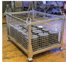
重量物の移動・保管