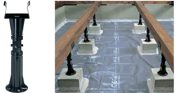
●ブラック色(使用例:東石の場合)