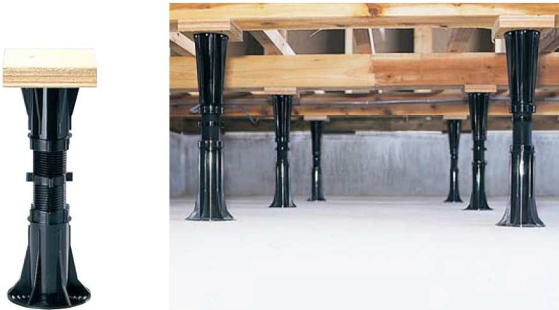
●ブラック色(使用例:土間コンクリートの場合)