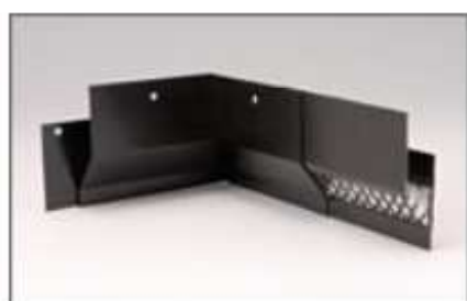
EPコーナーブラケットU