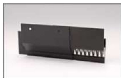
EPジョイントブラケット