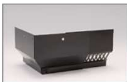
EPコーナーブラケットS