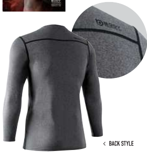
< BACK STYLE