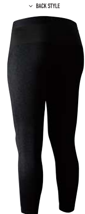
< BACK STYLE