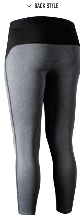
< BACK STYLE