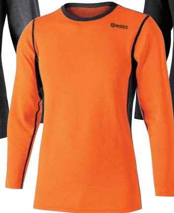
48. オレンジ×ブラック