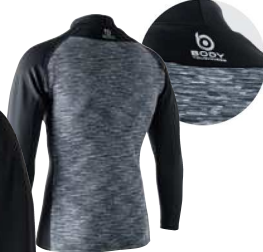
49. カモフラ×ブラック