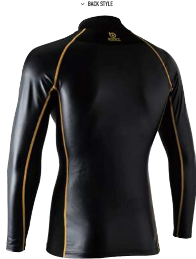
41. ブラック×イエロー