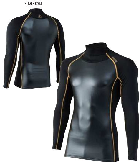
41. ブラック×イエロー