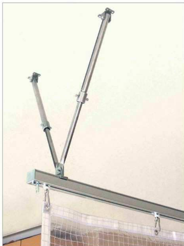
スチール製大型伸縮吊棒