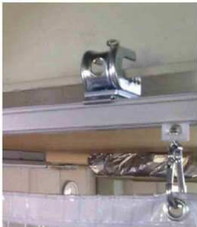
クランプ付 ブラケットベースS