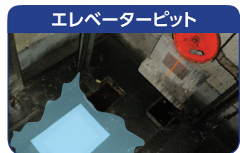
エレベーターピット