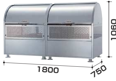
CKM-TN180R型 連結タイプ ¥298,000