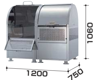
CKM-TN120R型 連結タイプ ¥242,000