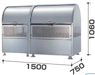
CKM-TN150R型 連結タイプ ¥270,000