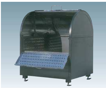
▲オプションのアジャスター、ロータリーダンパーを取付した写真です。