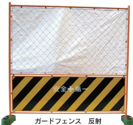
ガードフェンス 反射 1800×1800mm B-036-01