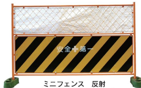
ミニフェンス 反射 1200×1800mm B-006-01