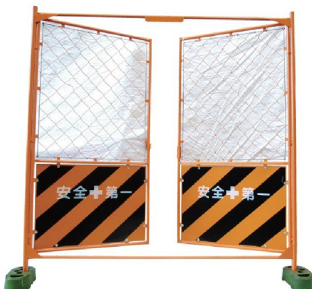
両開き扉付フェンス 1800×1800mm B-601-50