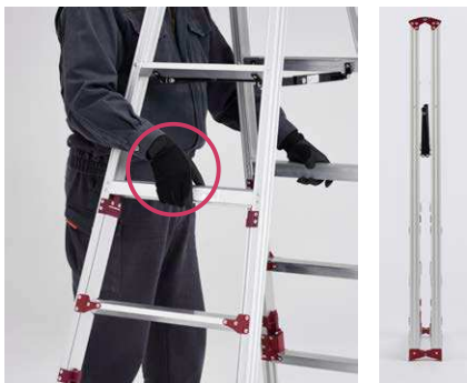
伸縮操作バー真ん中を引き上げれば 2脚同時に伸縮できます