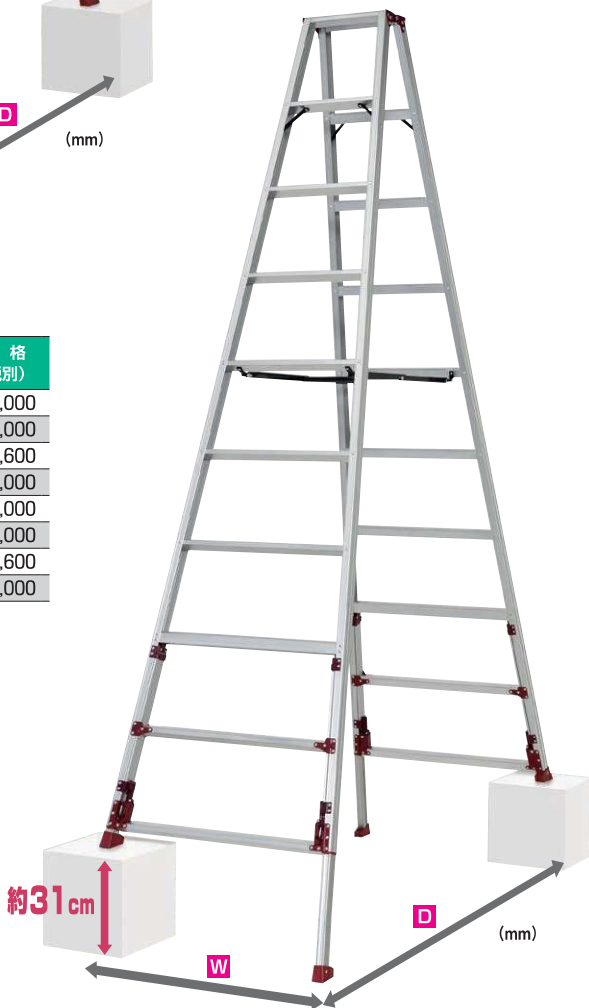
SXJ-300A (段差設置状態) ※掲載写真の段差は撮影のためのものです