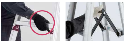
伸縮操作バーの端を引き上げれば 1脚伸縮できます