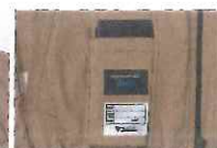
03 左内側 バッテリー専用ポケット