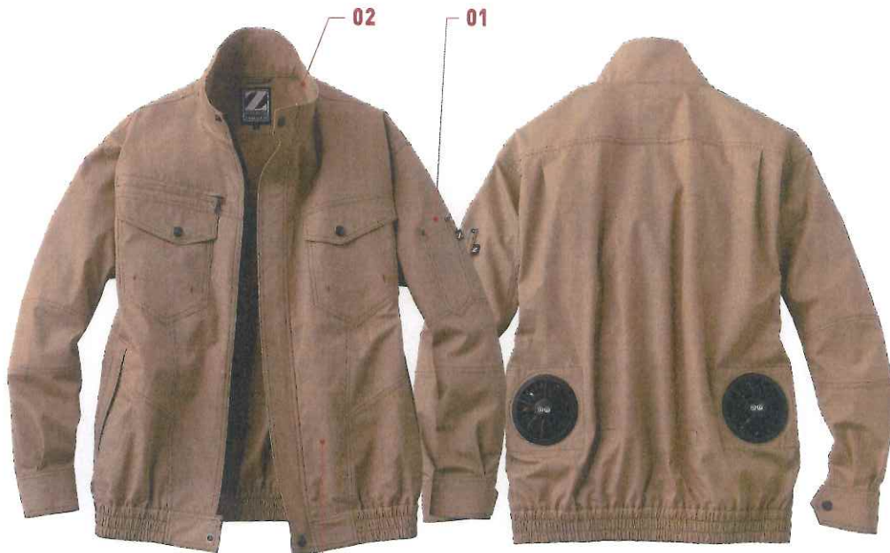
02 01 03 キャメル(C/134)