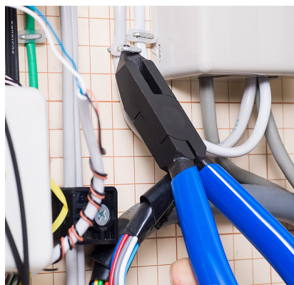
ステップルはずしに