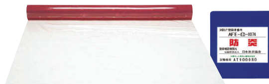
アキレス フラーレ