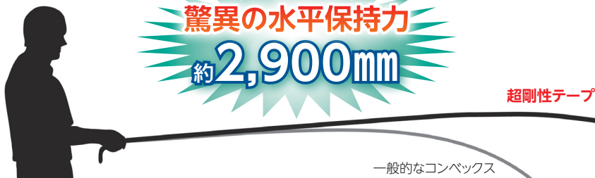
一般的なコンベックス