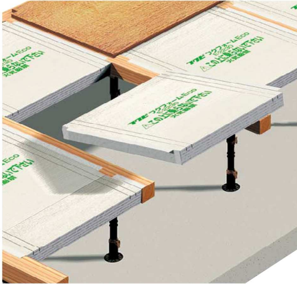
根太無し一般組納まり