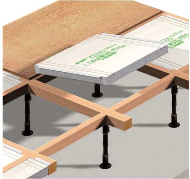
根太無し格子組納まり