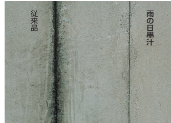
墨打ち比較テスト